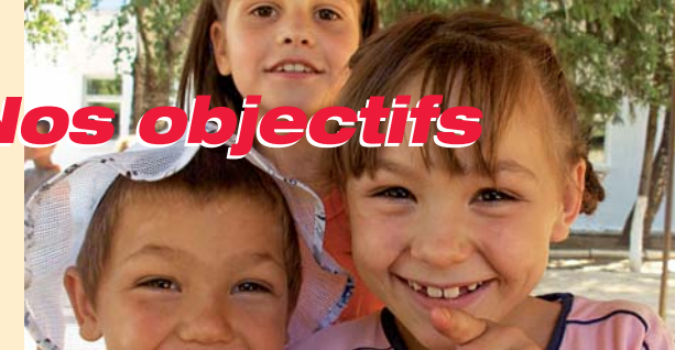
▶ Centre « Divertes » pour enfants en situation de handicap ONG Prietenii copiilor, République de Moldavie

L e PROCOPIL est un programme pilote initié en septembre 2005. Au-delà des réalisations (plus de 80 projets) déjà mises en œuvre pour les enfants, nos objectifs sont plus vastes et ambitieux :