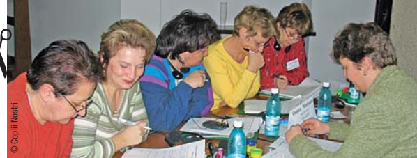
◀ Session de formation éducation parentale Fondation Copiii Nostrî, Roumanie

▶ Je retourne le présent Accord , accompagné d'un Relevé d'Identité Bancaire ou Postal , sous enveloppe à : Solidarité Laïque, 22 rue Corvisart 75013 Paris.