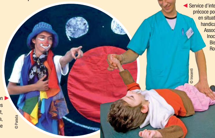
Service d'intervention précoce pour enfants en situation de handicap, Association Inocenti, Bistrita, Roumanie

Service d'intervention pour les enfants des rues de Bucarest, Association Parada, Roumanie