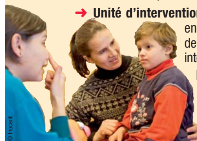
▶ Service d'intervention précoce auprès de jeunes enfants en situation de handicap. Association Inocenti, Roumanie