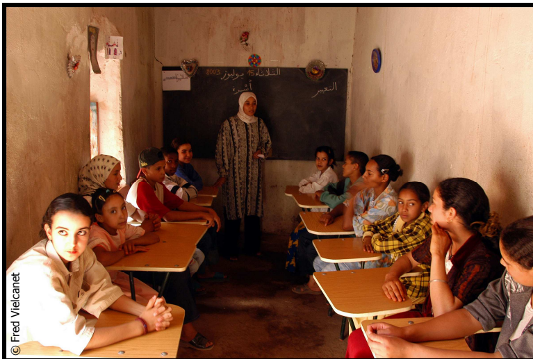
Une salle de classe au Maroc

- L'équipe pédagogique de l'école Anas Abou Malik avec l'association Likaa mènent un projet d'équipement et d'aménagement d'une salle de psychomotricité pour favoriser l'intégration des enfants handicapés.