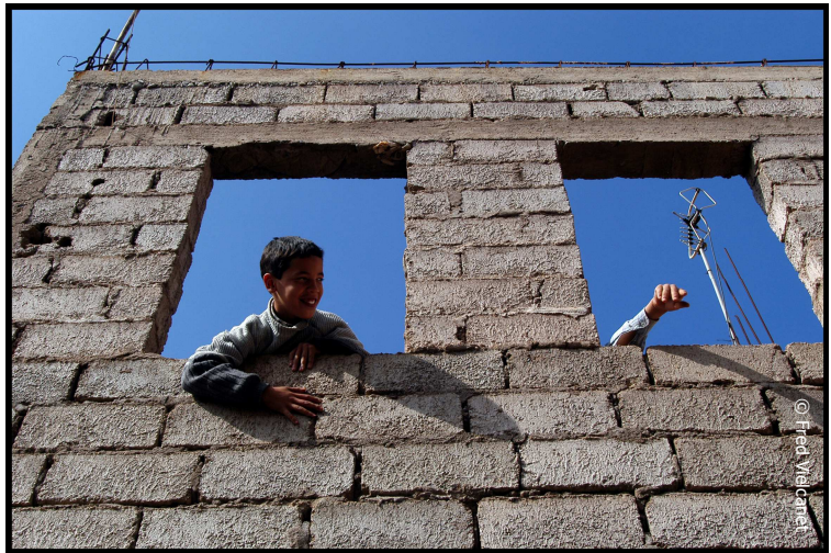
Ecole en construction

- L'association AEDRA construit dix salles de classes, deux logements, dix latrines et deux bibliothèques scolaires et organise vingt sessions de sensibilisation à destination des enseignants dans la région rurale du Draa.