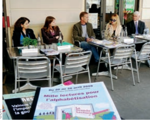
« Grande lecture » à Paris le 23 avril